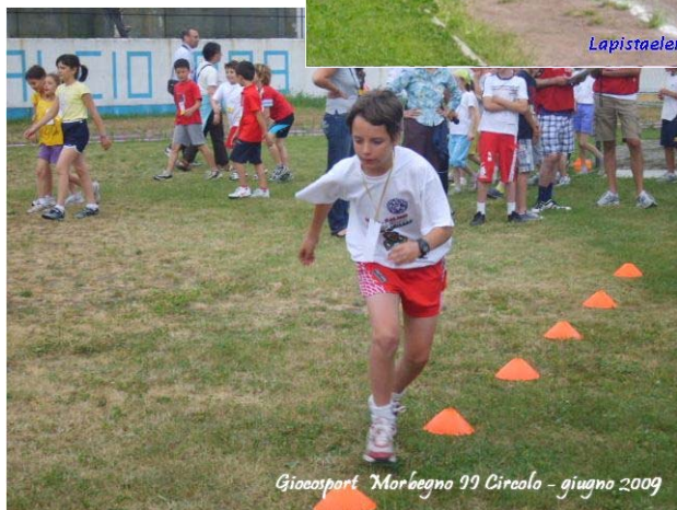
Gioceosport Morbegno 99 Circolo - giugno 2009