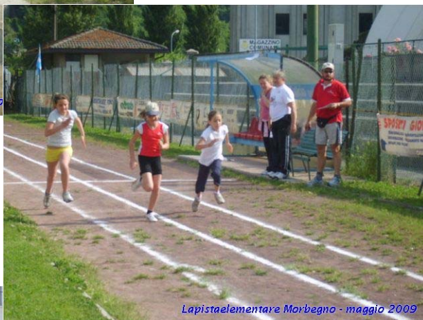
Lapistaelementare Morbegno - maggio 2009